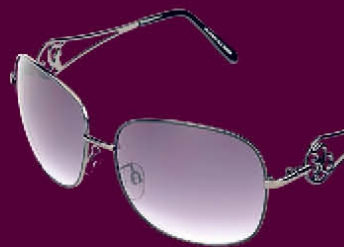
HD 0020 C.03