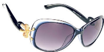
HD 0006 C.19