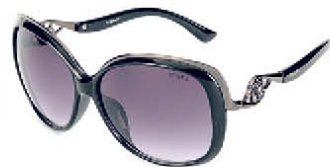
HD 0011 C.01