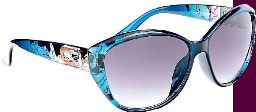
HD 0022 C.02

Знакомьтесь, коллекция солнцезащитных очков - ITISF4. Бренд для молодых мужчин и женщин, стремящихся к яркому, современному, динамичному стилю. Приглашаем в салоны «Счастливый взгляд» познакомиться с творением итальянских дизайнеров.