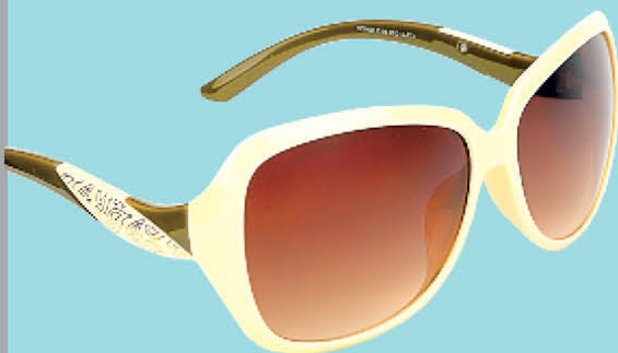
HD 0009 C.06