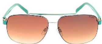
HD 0001 C.27